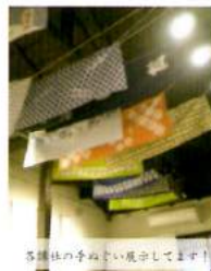
各講社の準備が整い風通ししています！

わいわいぞうしがや調べ 雑司ヶ谷案内処二階ギャラリー とろろ 八月三十一日(土)～十月二十三日(水) とろろ 十時半～十六時半まで開館 木曜休館