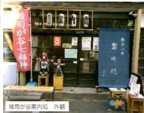
雑司ヶ谷案内処 外観