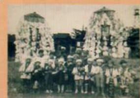
(講の名前は不明 戦前の写真か)

万燈の中の灯籠部分を五角形にこだわり、72°の角度を成功させるために何度も試行錯誤した さらに南無妙法蓮華經の南無を取っても意味が通じるため、五にこだわり、妙法蓮華經を灯籠の一面に一文字ずつ書いた 高田南睦