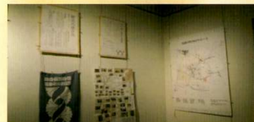
御会式・御会式連合会の紹介、 わいわいぞうしがやの紹介 各講社の町内周りルートの紹介