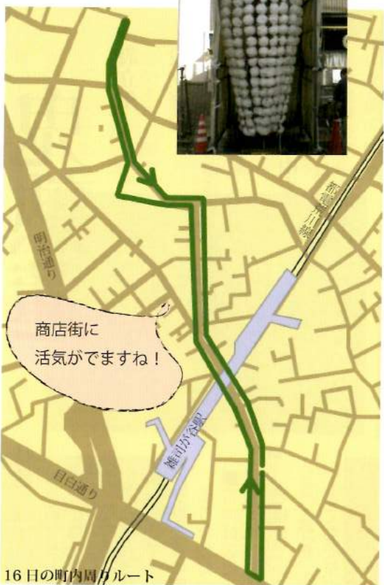
16日の町内周りルート