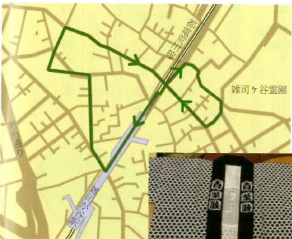
16日の町内周りルート